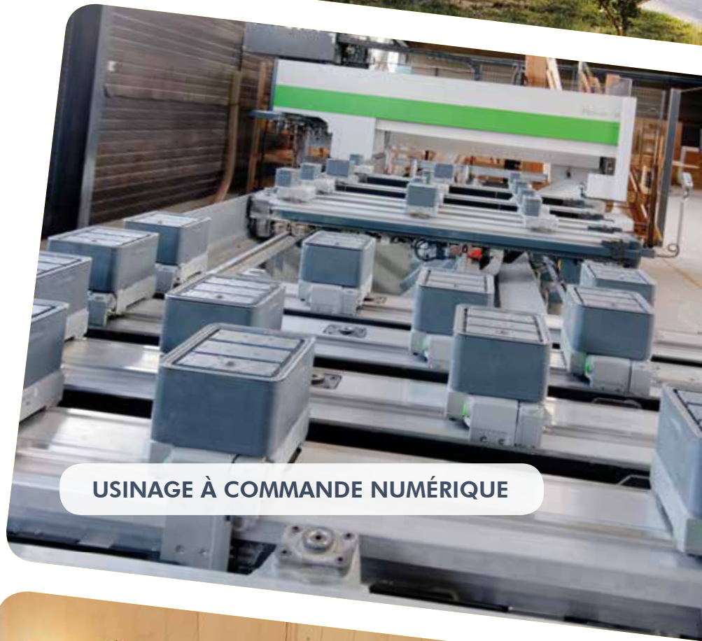
USINAGE À COMMANDE NUMÉRIQUE